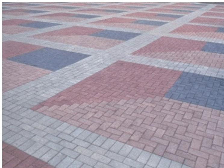
Piso em concreto intertravado, tipo paver, 20 x 10 cm.

O arremate dos blocos junto às guias deverá ser feito com blocos cortados (meia peça) com guilhotina ou outra ferramenta que propicie o corte regular das peças (quando necessário).