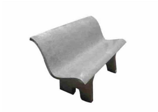
Detalhe de banco de concreto pré-moldado.