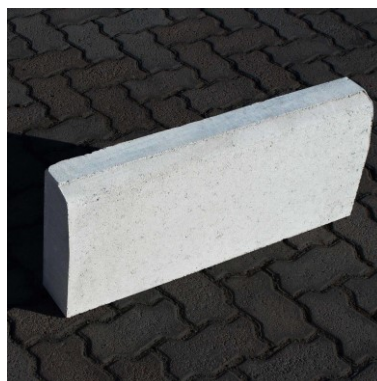
Meio-fio para canteiros/jardim (contraventamento).

Todo o rejuntamento do meio-fio pré-moldado deverá ser feito com argamassa de cimento e areia grossa no traço 1:4.