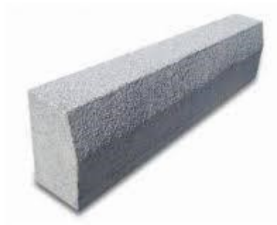
Meio-fio para perímetro externo (contraventamento).

As valas para assentamento deverão ter profundidade tal que, o meio-fio fique enterrado no mínimo 10 cm. O fundo das valas onde serão assentados os meios-fios deverá ser regularizado e apiloado.